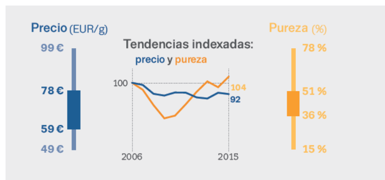
Gráfico No.1 Precio y pureza (tendencias indexadas) 2006-2015

Fuente: Observatorio Europeo de las Drogas y las Toxicomanías OEDT (2017), Informe Europeo sobre Drogas 2017: Tendencias y novedades, Oficina de Publicaciones de la Unión Europea, Luxemburgo.