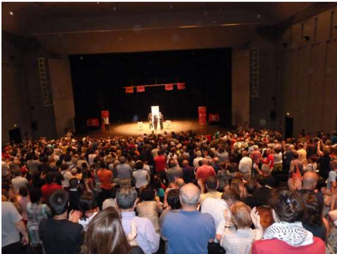
El público aplaude de pie la conferencia que acaba de dar el presidente de LIBERA Luigi Ciotti en el teatro de la ciudad de Senigallia, en junio de 2013.

garante del espacio, una veintena de organizaciones dieron nacimiento a la red LIBERA, asociaciones, nombres y números contra la mafia.