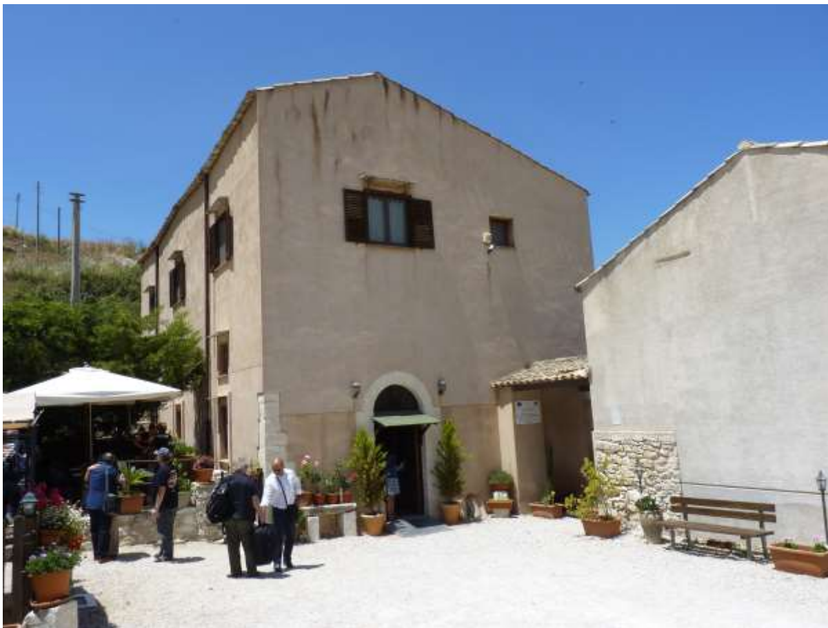
Inmueble confiscado a la mafia hoy convertida en la hacienda agroturística Portella della Ginestra.

la lógica de consumo del mercado a través de programas que sean financiados por el Estado con fondos incautados en efectivo.