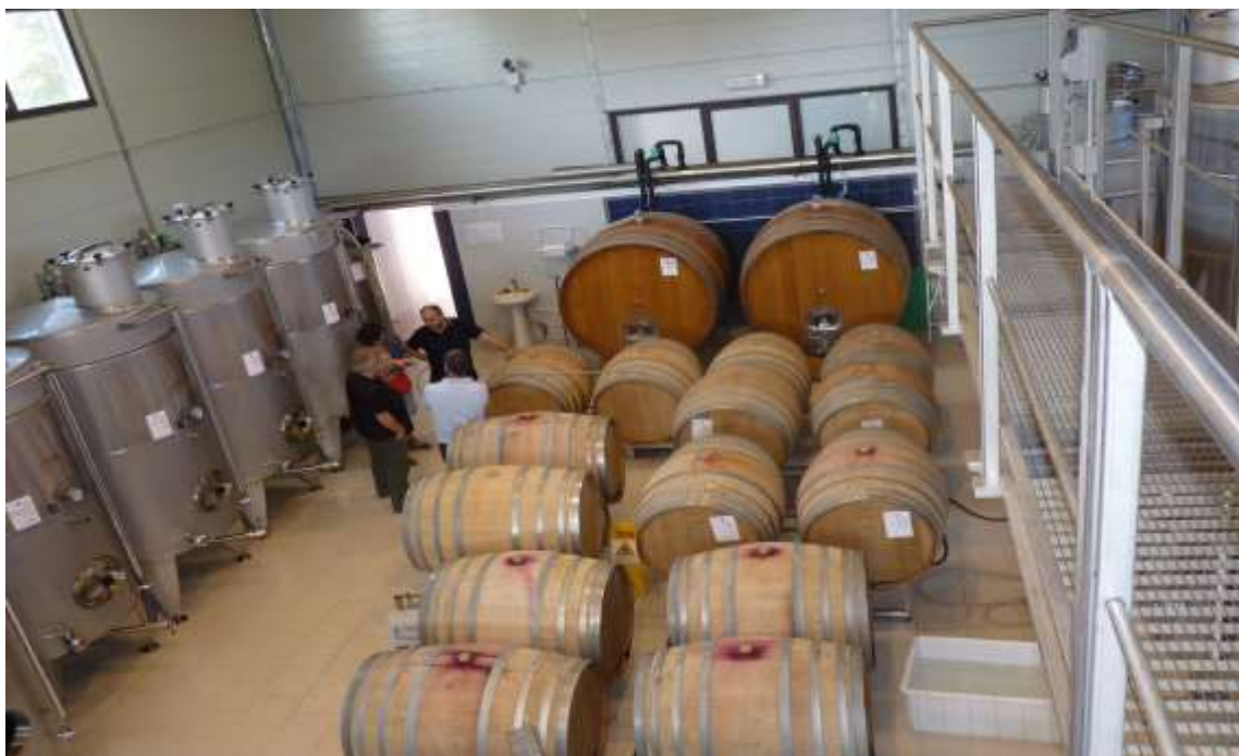
Instalaciones de la Cantina I Cento Passi, bodega confiscada a la mafia en la región siciliana.

Pues efectivamente, al poco tiempo de la aplicación de la ley de incautación de bienes, los mafiosos comenzaron a crear sus propias cooperativas como artificio para recuperar de esta manera sus tierras e inmuebles. Y cuando no pudieron avanzar con cooperativas propias, se las ingeniaron para infiltrar las cooperativas que sí respondían a fines sociales, colocando a su gente entre los socios fundadores o mediante los procesos de incorporación de nuevos cooperativistas. Es por ello que LIBERA lleva adelante controles continuos que tienen por misión monitorear, evaluar e identificar este tipo de infiltraciones. También hay iniciativas impulsadas por el Estado que atentan contra la cultura creada de fortalecer las cooperativas, como el intento del ex presidente Silvio Berlusconi de vender los bienes incautados, a lo que LIBERA se opuso decididamente bajo el argumento de que “los bienes morales no se pueden vender. Los primeros que comprarían serían los mafiosos.”