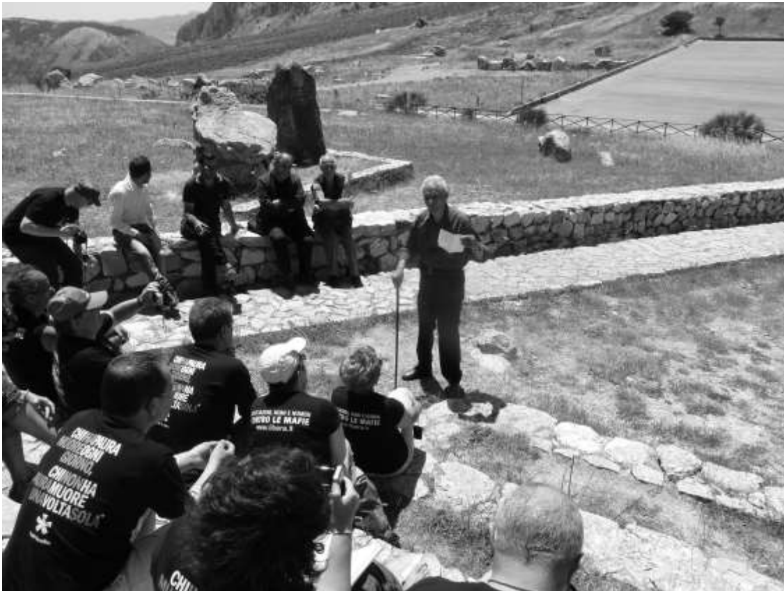
Una de las actividades de LIBERA en el marco de sus programas de recuperación de la memoria, con sobrevivientes de una matanza de pobladores ocurrida en 1947 en Portella della Ginestra. (Foto: Carlos March).