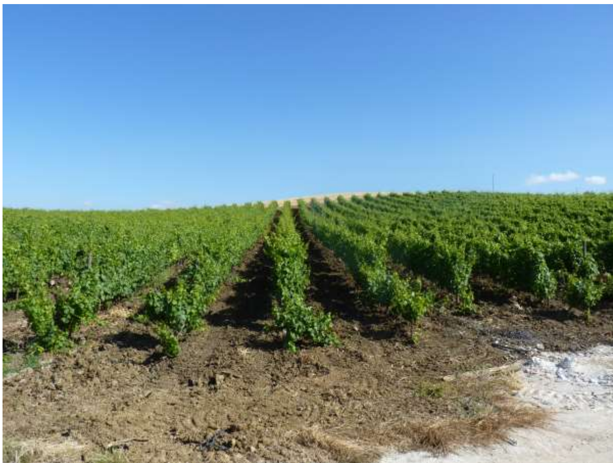
Plantaciones en las tierras de la Cantina I Cento Passi. La superficie confiscada a la mafia en las que actúa LIBERA llegan a 450 hectáreas donde se cosecha principalmente uva y algo de trigo.

Los bienes confiscados a la mafia son cerca de cien y pueden encontrarse en las cuatro regiones del sur italiano, con un claro predominio de Puglia y de Sicilia (casi la mitad de ese total), por sobre Calabria y Campania. Las restantes propiedades se concentran principalmente en Lombardía y Lazio.