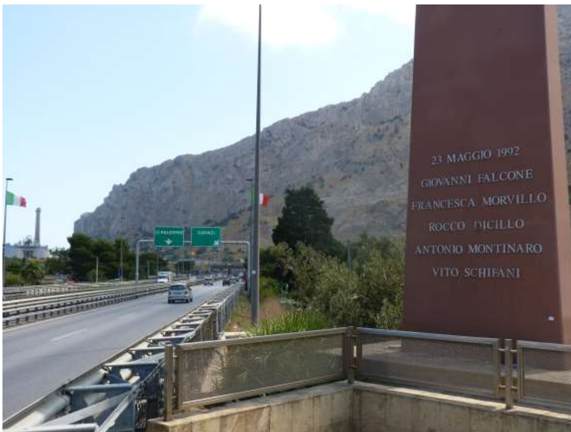
Lugar donde la mafia hizo explotar la bomba que voló el auto del juez del Mani pulite Giovanni Falcone, en la ruta a Palermo el 23 de mayo de 1992. (Foto: Carlos March).

Sí, claro. Después de 1992 –cuando fueron asesinados los jueces antimafia Giovanni Falcone y Paolo Borsellino– hubo tres factores clave en la lucha contra los mafiosos. El primero es el fenómeno de los arrepentidos, que nunca se había visto. Ellos contaron detalles sobre cómo funcionaban sus organizaciones, pero nunca hablaron de su vínculo con los políticos. “Eso sí que es muy peligroso”, decían. El segundo factor es la aplicación de la tecnología a las investigaciones, en particular las escuchas telefónicas y ambientales. El tercero es golpear a la mafia en su economía. Hay que profundizar este camino.