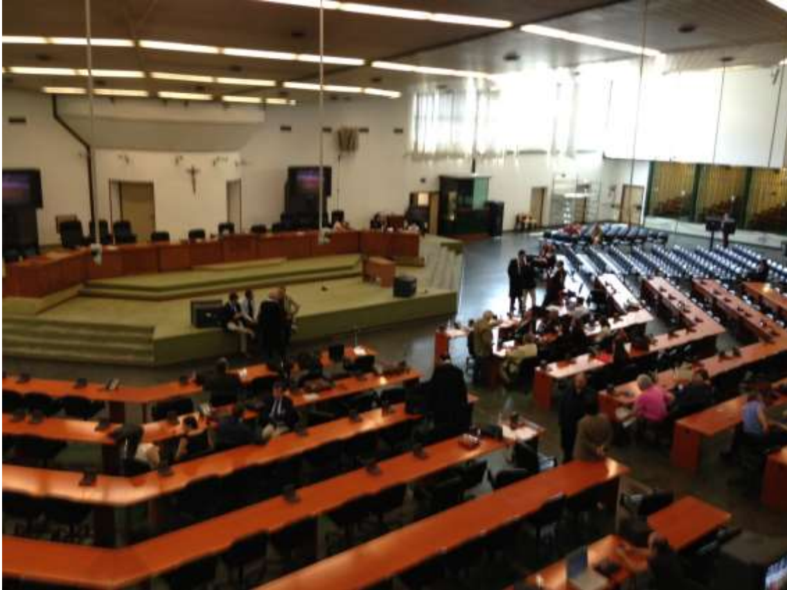
Sala de audiencias donde se llevan adelante los juicios que vinculan a la mafia con funcionarios públicos y dirigentes políticos en la prisión de Palermo.

LIBERA no tiene contacto con ningún miembro de la mafia ni sus abogados. Sí suele tomar ocasionales contacto con arrepentidos, a los que divide en dos perfiles: aquellos que han sido testigos de actos mafiosos y aquellos que protagonizaron hechos desde las estructuras de la mafia.