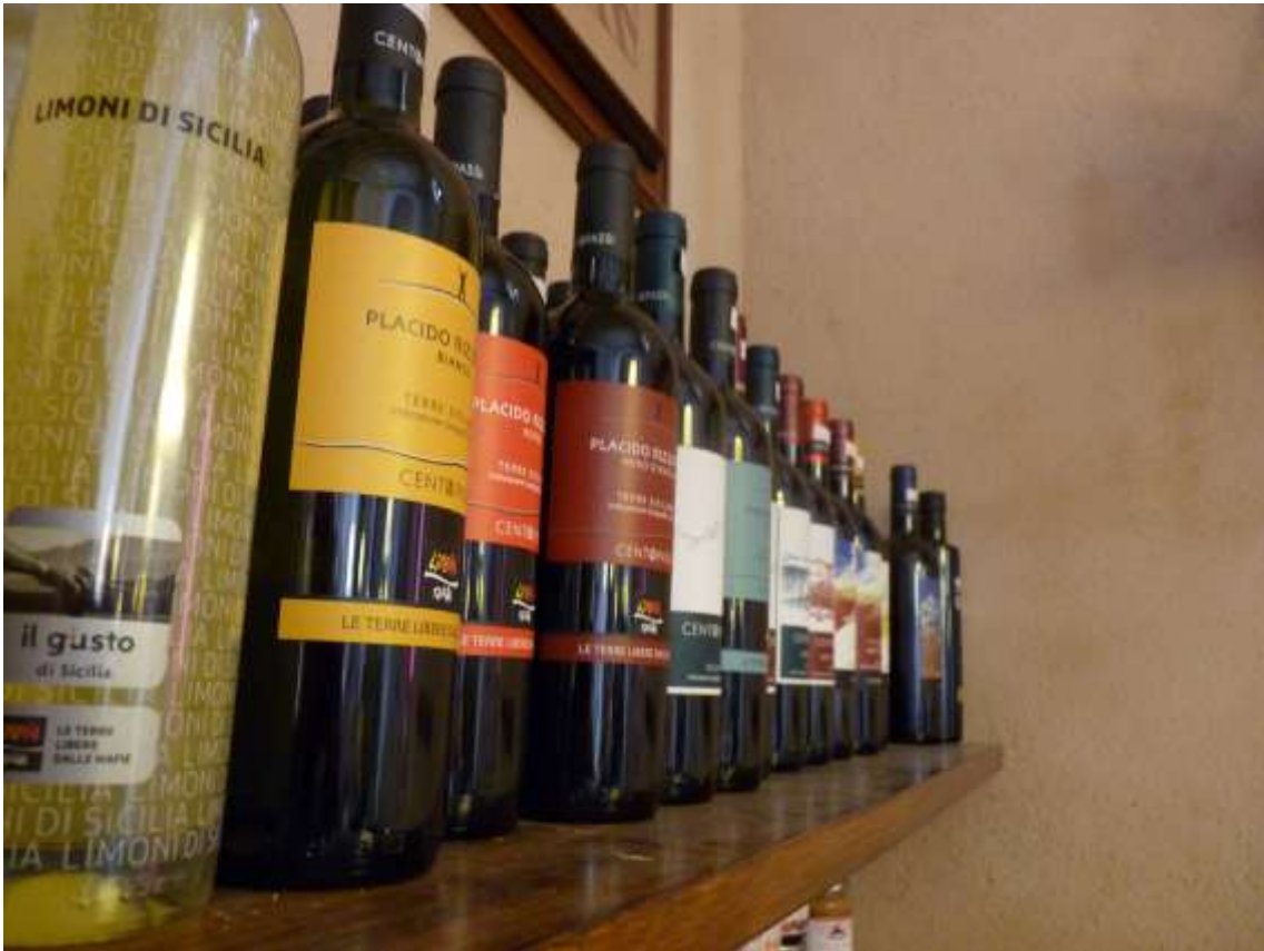
Productos de las bodegas confiscadas a la mafia apoyadas por el programa LIBERA TERRA.

Los bienes incautados también son instrumentos para crear una nueva cultura y mentalidad en los mismos lugares donde la mafia está actuando, pues al confiscarse un bien y darle utilidad pública, la gente percibe que se beneficia más que cuando lo regentea la mafia. Por ejemplo, si bien LIBERA no administra directamente los bienes, se hizo cargo de una fábrica de cemento incautada manteniendo a los mismos obreros que había empleado la mafia, a quienes le brindó más beneficios.