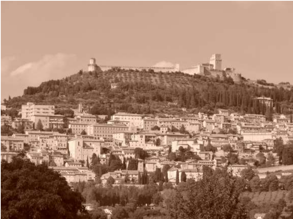
El histórico pueblo de Asisi, lugar donde Tonio reside y ejerce el sacerdocio..

¿La confiscación de sus bienes fue efectiva para reducir el poder de los mafiosos?