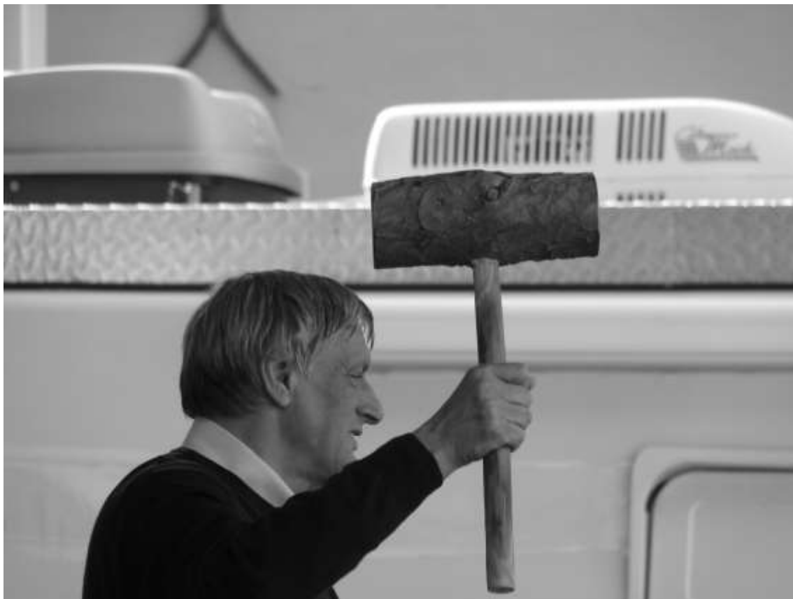
Luigi Ciotti bajando el martillo en la subasta organizada por Radio RAI a beneficio de LIBERA, en junio de 2013 en la ciudad de Senigallia.

débil, triunfa la corrupción que quita oportunidades. Y sabe que la falta de oportunidades hace que la única oportunidad sea la mafia.