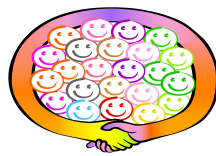
Cauce Ciudadano A.C.